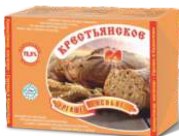
Масло «Крестьянское» особое, 72,5%, ГОСТ Р, 180 гр, 480 гр, 5 кг, 12 кг, 20 кг.

При содержании более 50% молочного жира классифицируются как сливочно-растительные спреды :