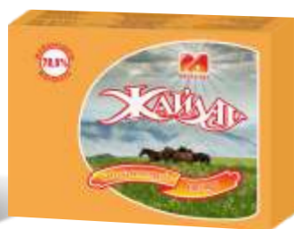
Масло «Жайлау» сливочное, 72,5% и 82,5% ГОСТ Р, 180 гр, 450 гр, 5 кг, 12 кг, 20 кг.