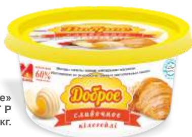
Масло «Доброе» сливочное, 60% ГОСТ Р 250 гр, 5 кг и 12 кг.

Масло «Доброе» сливочный вкус в монолитном виде 72,5% и 82,5% ГОСТ Р, 5 кг и 12 кг.