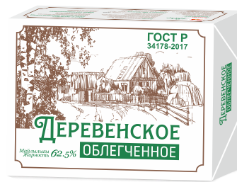
Спред Деревенское облегченное 62,5% 180 гр, 480 гр

Масло «Доброе» сливочный вкус в монолитном виде 72,5% и 82,5% ГОСТ Р, 5 кг и 12 кг.