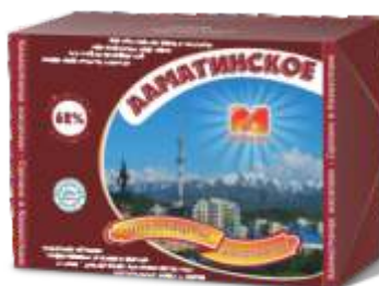
Масло «Алма-Атинское» шоколадное 62% ГОСТ Р, 180 гр, 5 кг, 12 кг, 20 кг.

При содержании молочного жира менее 15 % и полном отсутствии классифицируется как растительно-жировые спреды :