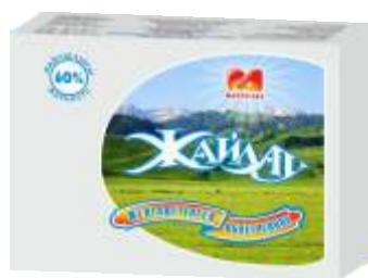
Масло «Жайлау» облегченное, 60% ГОСТ Р, 180 гр., 450 гр 5 кг, 12 кг, 20 кг.

При содержании молочного жира от 15 % до 50 % классифицируется как растительно-сливочные спреды :