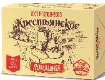
Масло "Крестьянское" домашнее, 82,5 % ГОСТ Р