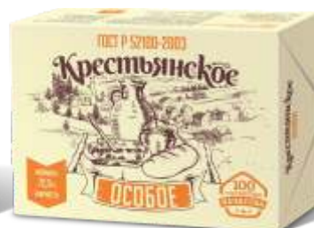
Масло "Крестьянское" особое, 72,5 %, ГОСТ Р 180 гр, 480 гр, 5 кг, 12 кг, 20 кг.

При содержании молочного жира от 15 % до 50 % классифицируется как растительно-сливочные спреды :