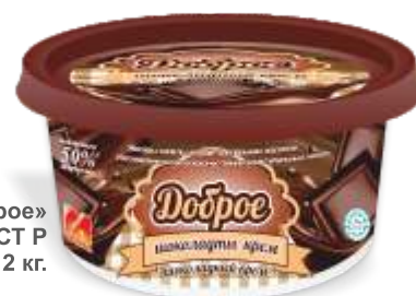
Масло «Доброе» шоколадное, 50% ГОСТ Р 180 гр, 250 гр, 5 кг и 12 кг.