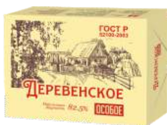
Спред Деревенское Особое 82,5 % 180 гр, 480 гр

При содержании молочного жира менее 15 % и полном отсутствии классифицируется как растительно-жировые спреды :