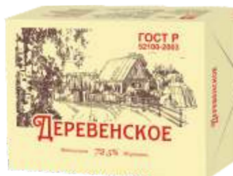
Спред Деревенское 72,5 %, 180 гр, 480 гр